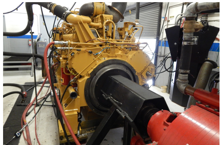
Prueba de dinamómetro