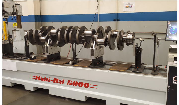
Equipo de balanceo

H-E Parts ofrece el mismo servicio de respuesta a todos los clientes. Esta coherencia garantiza que nuestros clientes sepan qué esperar de nosotros y puedan confiar en productos de calidad con un soporte de servicio inigualable para realizar el trabajo, a tiempo, dentro del presupuesto y sin daños. Es nuestra capacidad para cumplir nuestra promesa, trabajar con proveedores y clientes para extender la vida útil, reducir el tiempo de inactividad y trabajar con un alto nivel, lo que conduce a nuestro éxito compartido equipo.