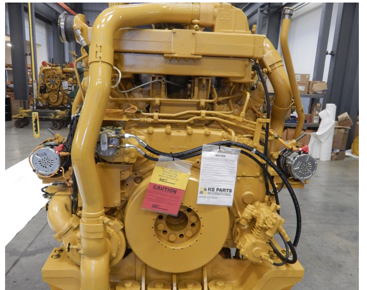
Motor 3524 StaTerra Power™

Las piezas de repuesto H-E Parts son compatibles con las marcas y/o modelos de equipos externos descritos. H-E Parts International no es un centro de reparación autorizado de estos equipos externos y no tiene afiliación con ningún fabricante de estos productos externos. Todas las marcas, fabricantes de equipos originales (OEM), números de partes o referencias son propiedad de las respectivas entidades OEM o sus afiliados. Estos términos son utilizados por H-E Parts International para identificación y referencias cruzadas únicamente y no tienen la intención de indicar afiliación o aprobación por parte de OEM, de H-E Parts International o sus productos.